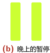
Figure 1: 掌门常用的暂停