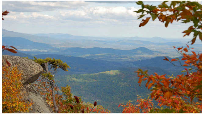
Figure 1. Picture

Quisque ullamcorper placerat ipsum. Cras nibh. Morbi vel justo vitae lacus tincidunt ultrices. Lorem ipsum dolor sit amet, consectetur adipiscing elit. In hac habitasse platea dictumst. Integer tempus convallis augue. Etiam facilisis. Nunc elementum fermentum wisi. Aenean placerat. Ut imperdiet, enim sed gravida sollicitudin, felis odio placerat quam, ac pulvinar elit purus eget enim. Nunc vitae tortor. Proin tempus nibh sit amet nisl. Vivamus quis tortor vitae risus porta vehicula.