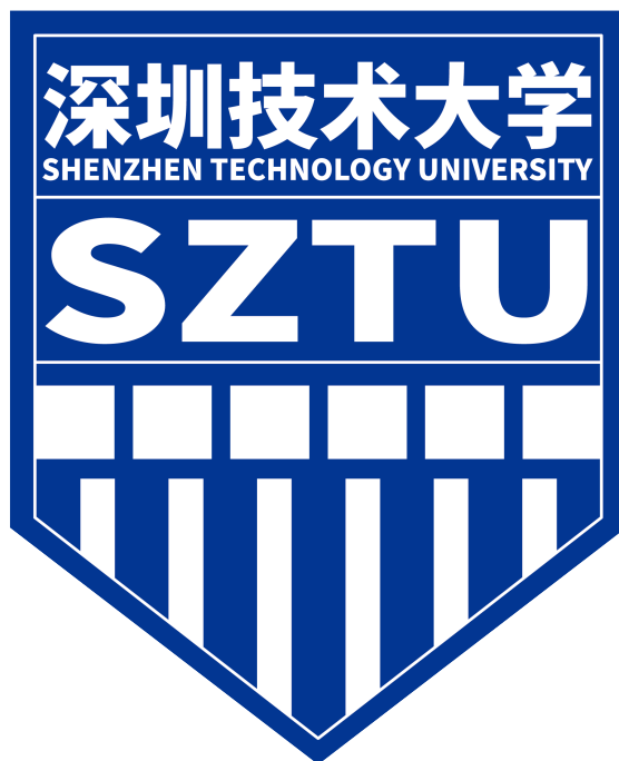
图 2.1 单图布局示例