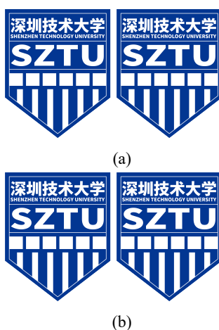
图 2.5 横排多图竖排布局