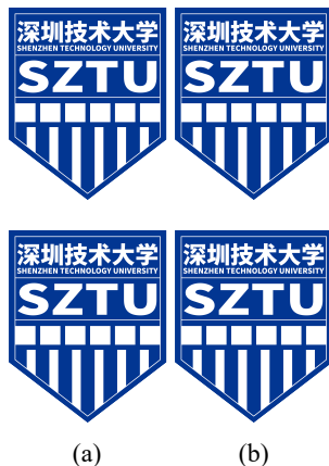
图 2.4 竖排多图横排布局