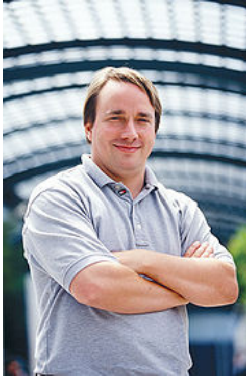
图 1.2 Linus Torvalds

Hello everybody out there using minix- I'm doing a (free) operation system (just a hobby, won't be big and professional like gnu) for 386(486) AT clones.