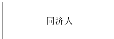
Figure 1.111 这是一个手动编号，不出现在索引中的图。