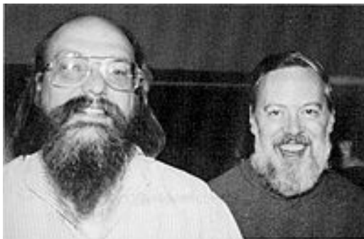
图 1.1 肯·汤普逊 (左) 和丹尼斯·里奇 (右)

UNIX 操作系统 (UNIX)，是美国 AT&T 公司 1971 年在 PDP-11 上运行的操作系统。具有多用户、多任务的特点，支持多种处理器架构，最早由肯·汤普逊 (Kenneth Lane Thompson)、丹尼斯·里奇 (Dennis MacAlistair Ritchie)，见图 1.1。和 Douglas McIlroy 于 1969 年在 AT&T 的贝尔实验室开发 ① 。