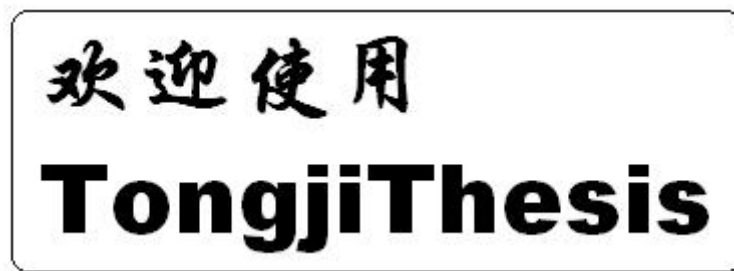
图 1 这是手动编号但不出现索引中的图片的例子

孔子与柳下季为友，柳下季之弟名曰盗跖。盗跖从卒九千人，横行天下，侵暴诸侯。穴室枢户，驱人牛马，取人妇女。贪得忘亲，不顾父母兄弟，不祭先祖。所过之邑，大国守城，小国入保，万民苦之。孔子谓柳下季曰：“夫为人父者，必能诏其子；为人兄者，必能教其弟。若父不能诏其子，兄不能教其弟，则无贵父子兄弟之亲矣。今先生，世之才士也，弟为盗跖，为天下害，而弗能教也，丘窃为先生羞之。丘请为先生往说之。”